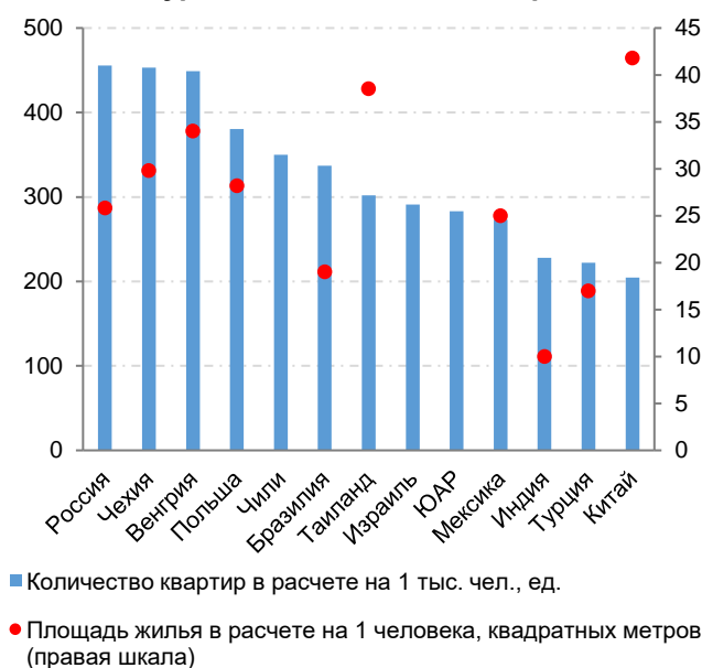
Рисунок 3. Обеспеченность жильем в России – на уровне сопоставимых стран

Примечание: под квартирами понимаются в том числе индивидуальные жилые строения.