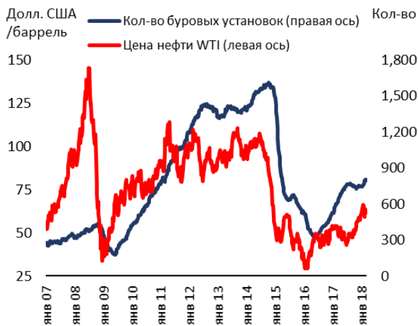
Рисунок 1. В феврале цены на нефть снизились