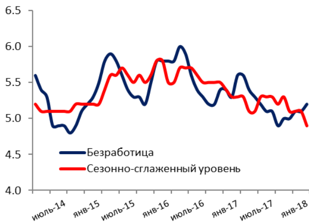
Рисунок 5. В январе ситуация на рынке труда была относительно стабильной