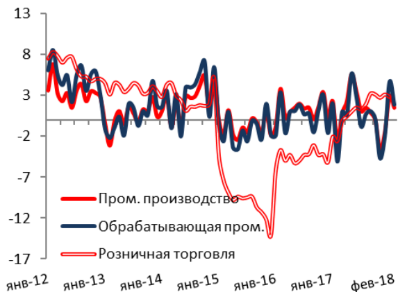
Рисунок 3. В январе промышленное производство ускорилось